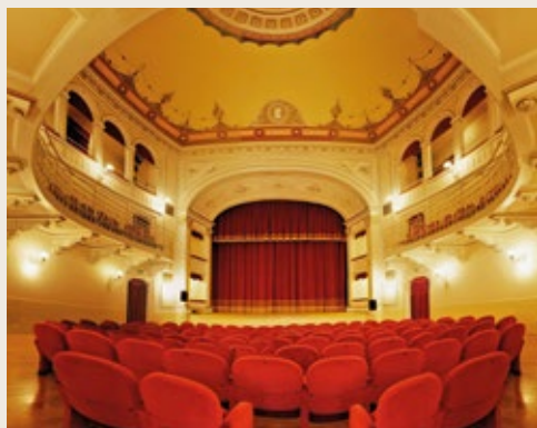
Teatro Castagnoli di Scansano, 1852